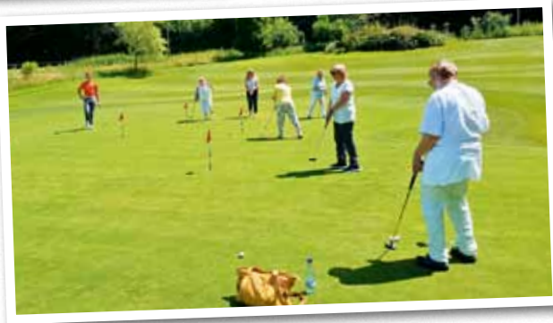
Beim Golf spielen