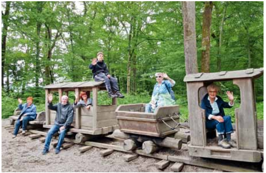
Am Park Le'h zu Diddeleng